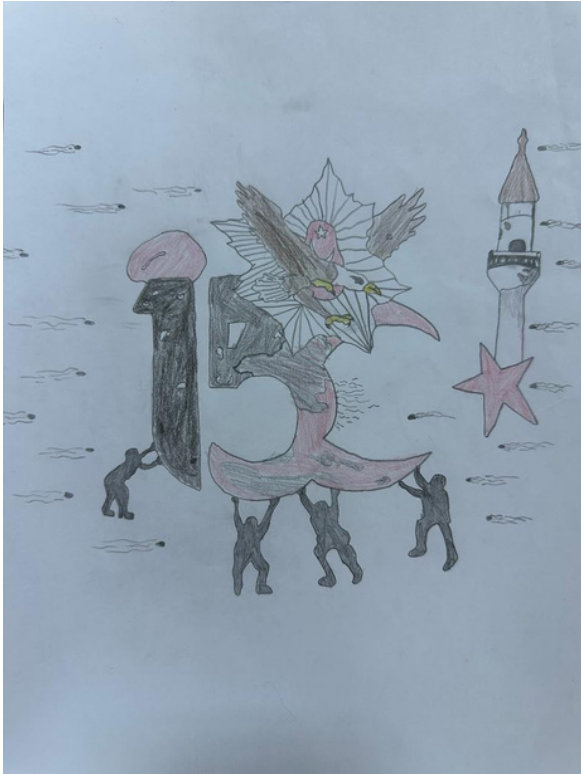
Ahmet Ayğın 5/C