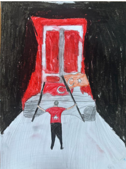
Hejar Bünyamin Okalin 6/E